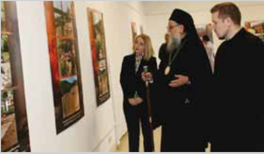
У Галерији Народног музеја отворена изложба под називом „Пчињски округ под НАТО бомбама“