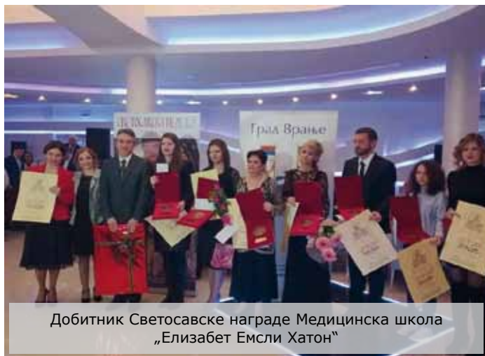
Добитник Светосавске награде Медицинска школа „Елизабет Емсли Хатон“