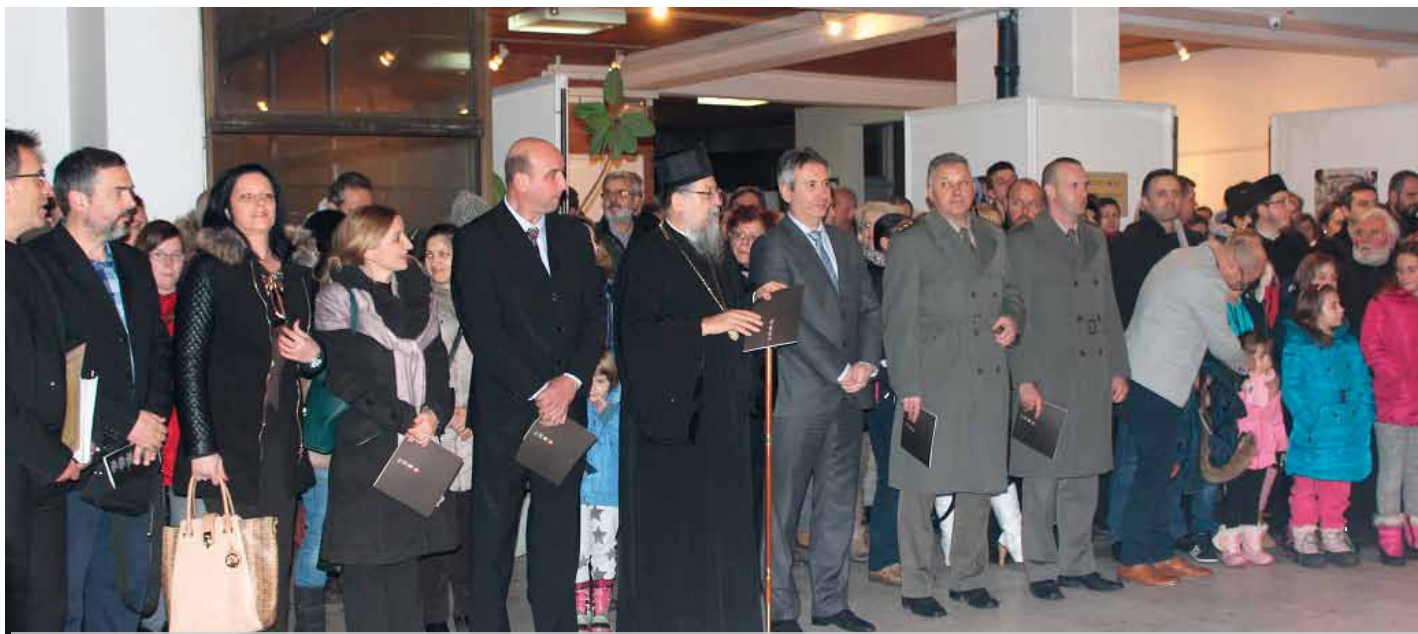
Отварање овогодишње манифестације