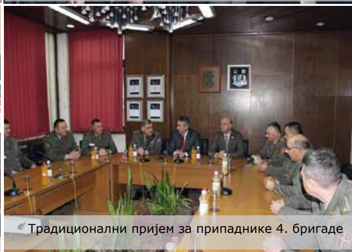
Традиционални пријем за припаднике 4. бригаде