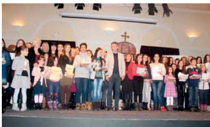
Награде ауторима најбољих литерарних радова