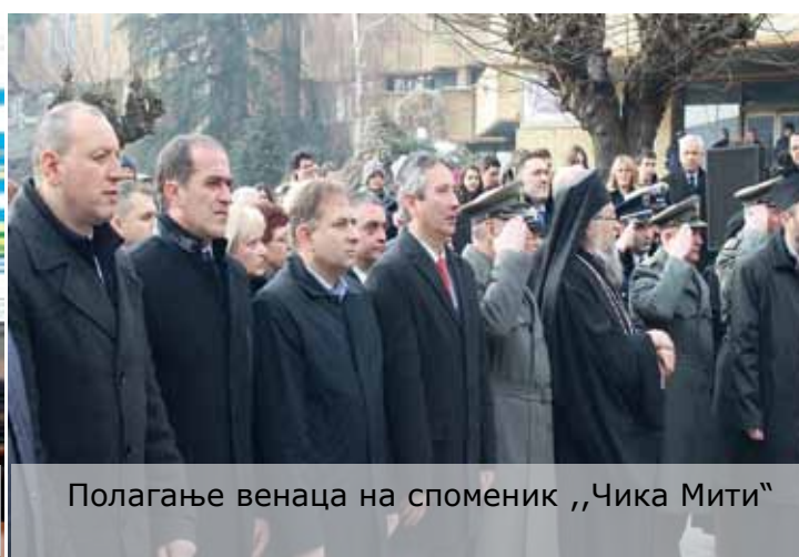
Полагање венаца на споменик „Чика Мити“